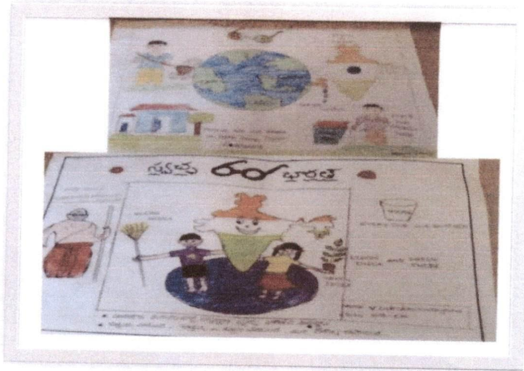
Drawn by School Children, MPUP School, Singampalli